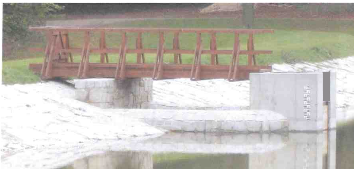
Obr.č.5. Pohľad na združený výpustný objekt .

4) Podrobný IGP sa vykoná, za účelom overenia inžiniersko geologických limitov základovej škáry, vhodnosti miestnych zemín do stabilizačnej časti hrádze, ílového tesnenie a zemníka.