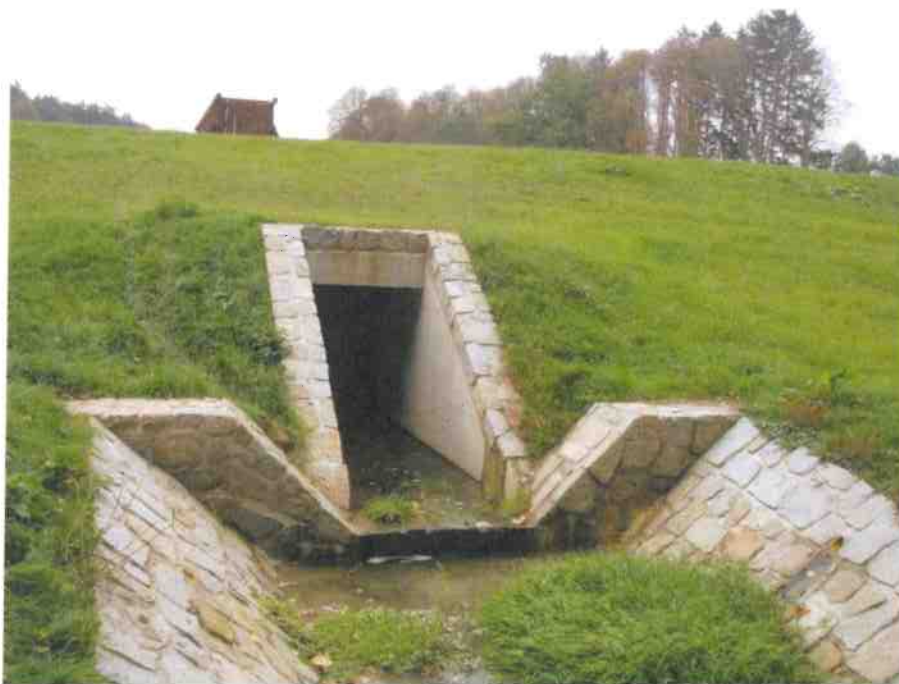
Obr.č.7. Pohľad na výpusť a vývarisko s kamennou dlažbou.

spodnej výpuste betonážou na mieste s 1 m dilatačným úsekom v strede, vytesnenými hydroizolačnými gumenými vložkami , napučiavacím pásom a pružným tmelom. Ukončenie rámu tvorí kamennobetónové čelo hr=1000 mm a šikmé krídla. Vývarisko dĺžky 10 m spomaľuje odtok.