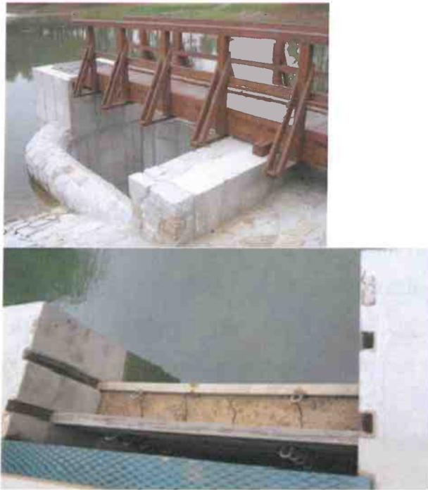
Obr.č.6. Pohľad na drevenú lávku nad združeným objektom a hradidlové dosky s ílom.

Spodná výpust' zemnej sypanej hrádze je tvorená ZB rámovým priepustom so svetlosťou \text{š}=1000 , \text{h}=2000 m, dĺžky 16 m v pozdĺžnom sklone 4,4 % . Priepust obdĺžnikového prierezu prevedie Q_{100} pri výške 1500 mm a pri rýchlosti vody 4,5 m/s. Na konci spodnej výpuste je výtokové čelo s korytom spevneným kam. dlažbou dĺžky 7,8 m a ukončením kamennobetónovým pásom 6x2,5x0,5 (C30/37). Výstavba