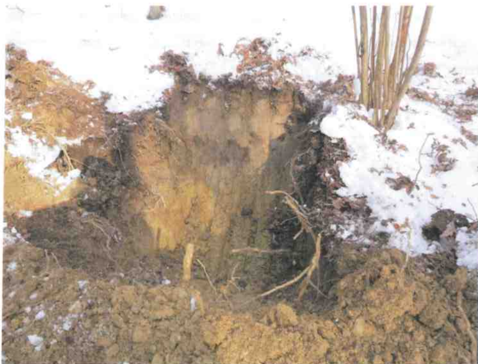
Obr. č.4. Ilovito- hlinité podložie je vhodný zdroj pre ílové tesnenie.