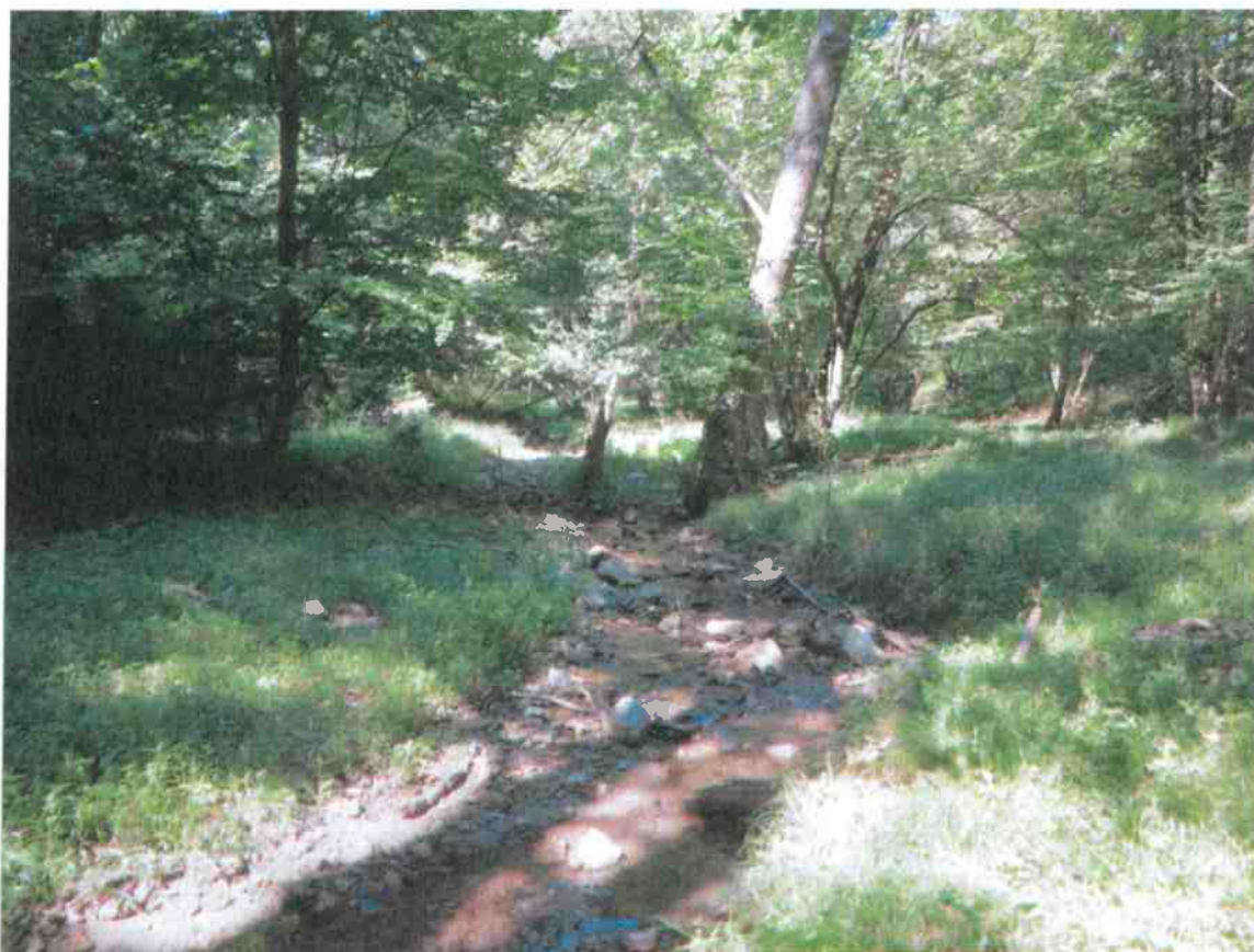
Obr. č. Pohľad na profil terénu v mieste hráde v doline vysýchajúceho toku Bystrý potok.

Malá vodná nádrž „ SO 06 Bystré pod mostom “ s akumulárným objemom vody 3 693 m 3 je umiestnená na údolnici jelšovo-hrabového a bukového lesného porastu neovulkanickými horninami a vulkanickými brekciami , priepustnými neogénnyimi horninami v podloží. Nádrž je umiestnená na toku Bystrý potok s upraveným lichobežníkovým korytom potoka na vtoku a výtoku. Spevnenie toku Bystrý potok, je dimenzovaný na bezpečné prevedenie Q_{100}=4,20 \text{ m}^3 \cdot \text{s}^{-1} . Zemná sypaná hrádza ma tvar lichobežníka a koruna hráde šířky 6 m dosahuje max. výšku na teréne 4,32 m. Sklony návodných svahov sú v sklone 1:2 a vzdušného svahu hráde 1:3. Hydoizolácia je tvorená kaučukovou EPDM fóliou hrúbky 1,5 mm s ochranou kamennou dlažbou a štrkom na návodnej strane hráde a na príľahlom dne celkovej šířky 22 m (12+10). Na vtoku je drevená prehrádzka šířky 18m, h=0,6/0,3 \text{ m} . Pre vypúšťanie vody z nádrže a manipuláciu s vodnou hladinou spolu s funkciou bezpečnostného prepadu je navrhnutý združený výpustný objekt .